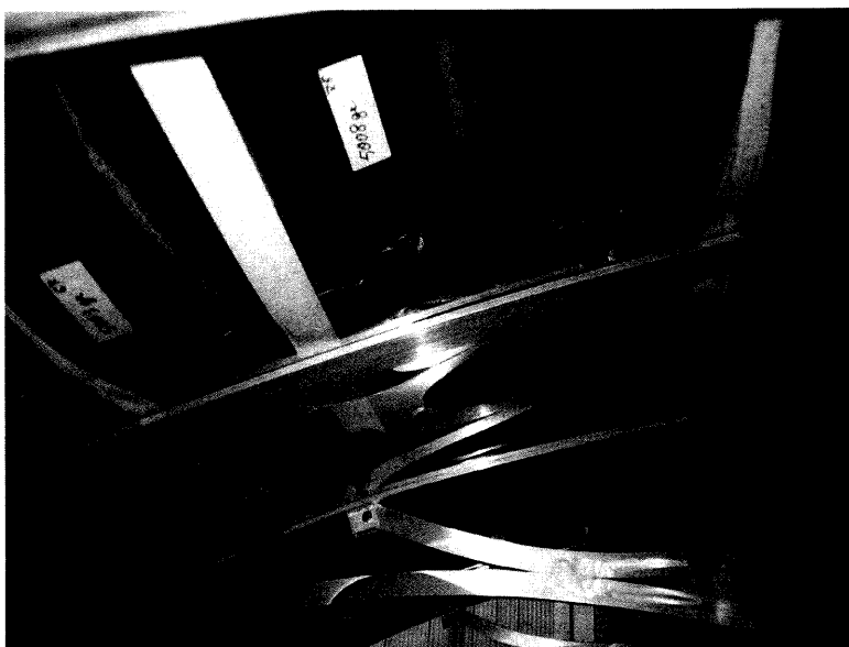
Fotografia del campione durante la prova di resistenza della struttura sotto carico uniformemente distribuito.