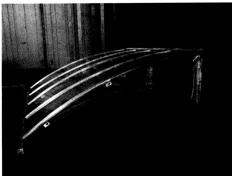
Fotografia del campione dopo la prova di resistenza della struttura sotto carico uniformemente distribuito.